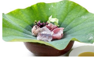
名代 【鮎のあらい】 川魚生洲八軒からはじまる美濃吉の名代の自慢の逸品でございます